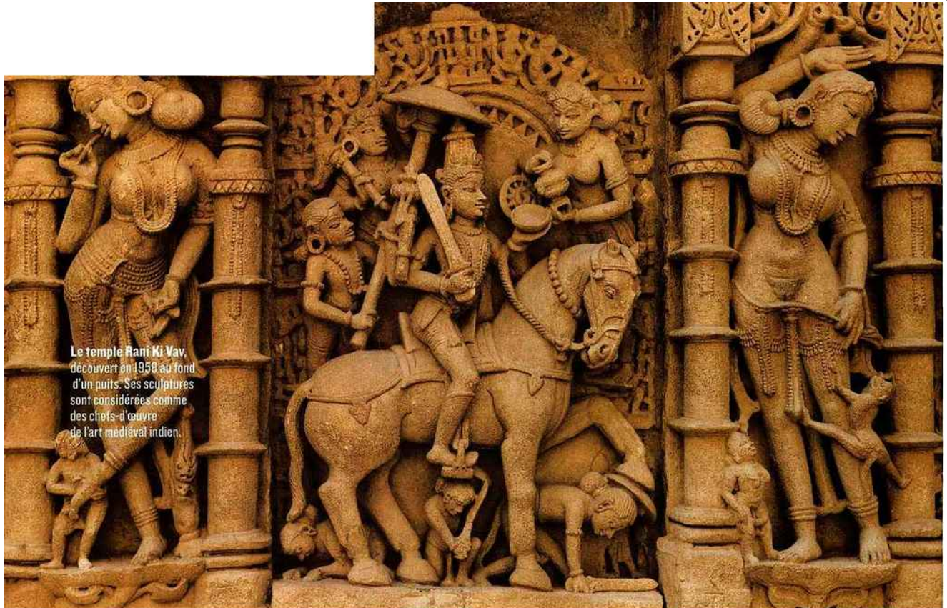
Le temple Rani Ki Vav, découvert en 1958 au fond d'un puits. Ses sculptures sont considérées comme des chefs-d'œuvre de l'art médiéval indien.