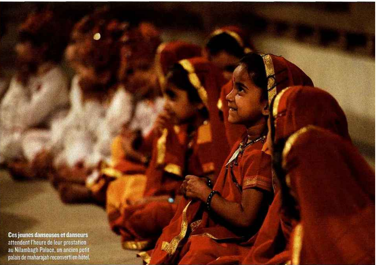
Ces jeunes danseuses et danseurs attendent l'heure de leur prestation au Nilambagh Palace, un ancien petit palais de maharajah reconverti en hôtel.