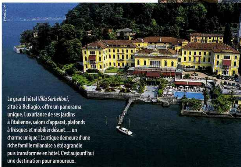
Le grand hôtel Villa Serbelloni , situé à Bellagio, offre un panorama unique. Luxuriance de ses jardins à l'italienne, salons d'apparat, plafonds à fresques et mobilier désuet... un charme unique ! L'antique demeure d'une riche famille milanaise a été agrandie puis transformée en hôtel. C'est aujourd'hui une destination pour amoureux.