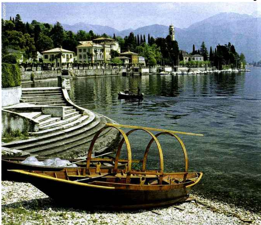
A Tremezzo se trouve la villa Carlotta. L'une des plus belles demeures du lac, au cœur d'un magnifique jardin riche de plus de cinq cents espèces de plantes.